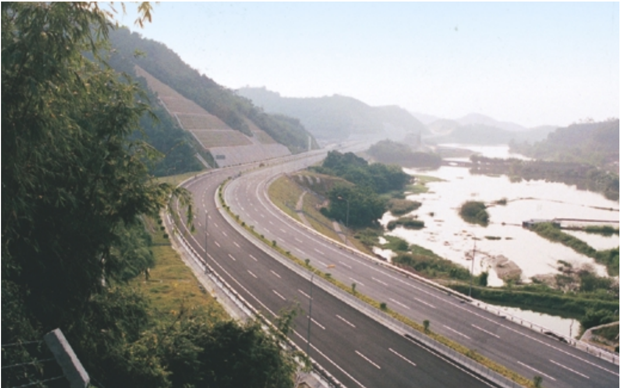
通車前的北二環高速公路

六線行車的北二環高速公路，全長42.4公里，設有九座互通立交及九個收費站，連接廣州市北面十一條高速公路、國道及省道，將有利於吸引北面南下的車流以及貫通廣州市北部東西向的交通。北二環高速公路已如期竣工並於二〇〇二年一月開始收費。二〇〇二年一月至三月份北二環高速公路平均每日收費交通流量為9,051架次，加權平均路費為每輛人民幣16.00元。