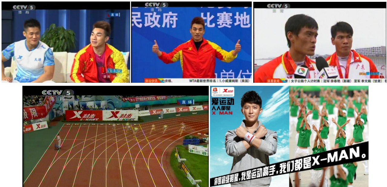
圖二：除在中央電影五台(CCTV-5)多個節目頻道多方位地報道全運會的賽事外，特步亦於平面媒體如地區報章《廣州日報》、《南方都市報》及網上媒體如微博及微信多方報道賽事進程。

在第 12 屆全運會期間，特步更推行了一系列的營銷宣傳攻勢，全面覆蓋電視、平面、網上等媒體，全面提升特步的品牌價值，效果斐然。