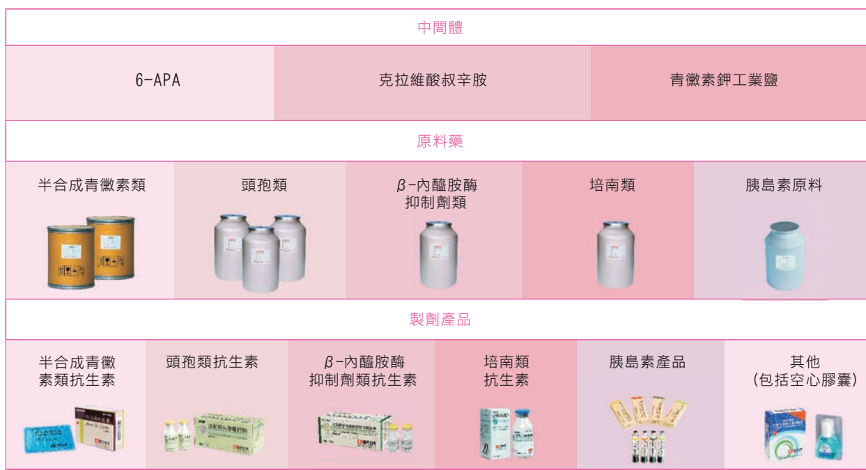
垂直一體化的生產經營模式 3

3. 同一顏色範圍代表同一系列產品，通過上游生產過程由中間體-原料藥-至下游製劑產品。