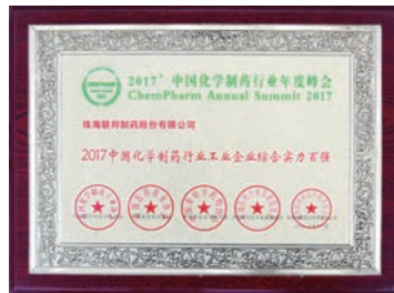
珠海公司-2017中國化學製藥行業 工業企業綜合實力百強