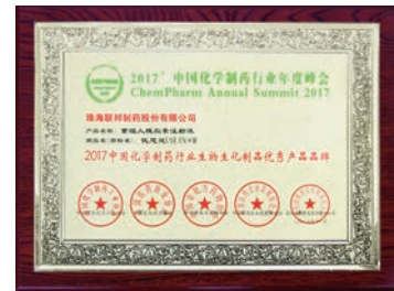
珠海公司-2017中國化學製藥行業 生物生化製品優秀產品品牌