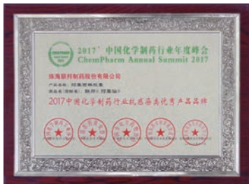
珠海公司-2017中國化學製藥行業 抗感染類優秀產品品牌

本年度，本集團位於珠海之生產基地的質檢中心第三次通過中國合格評定國家認可委員會(CNAS)的認可，同時榮獲「全國五一巾幗標兵崗」的稱號。此外，本集團的產品包括胰島素原料藥、培南類製劑、鹽酸美金剛及培南類抗生素原料藥均獲得「珠海市戰略性新興產業重點產品推廣目錄證書」，是本集團高品質生產的一大印證。在高水平、高要求的質量把關下，本集團榮獲多項獎項及榮譽，例如珠海生產基地同時獲得了「2017中國化學製藥行業工業企業綜合實力百強」、「2017中國化學製藥行業原料藥出口型優秀企業品牌」、「2017中國化學製藥行業生物生化製品優秀產品品牌」及「2017中國化學製藥行業抗感染類優秀產品品牌」的美譽，大大提升了本集團的商譽和知名度。