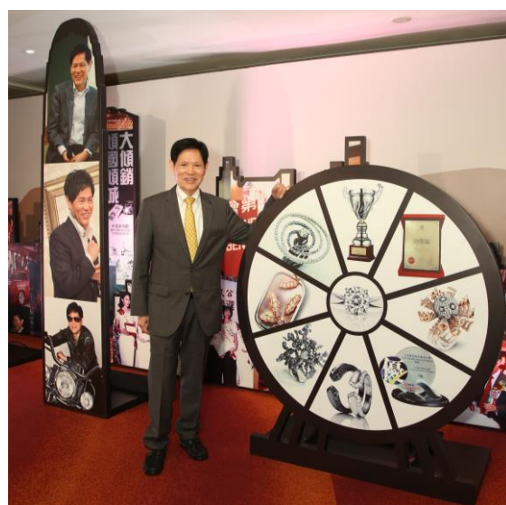
謝瑞麟先生渡過充滿精彩傳奇的八十載年華，見證珠寶業界的時代變遷