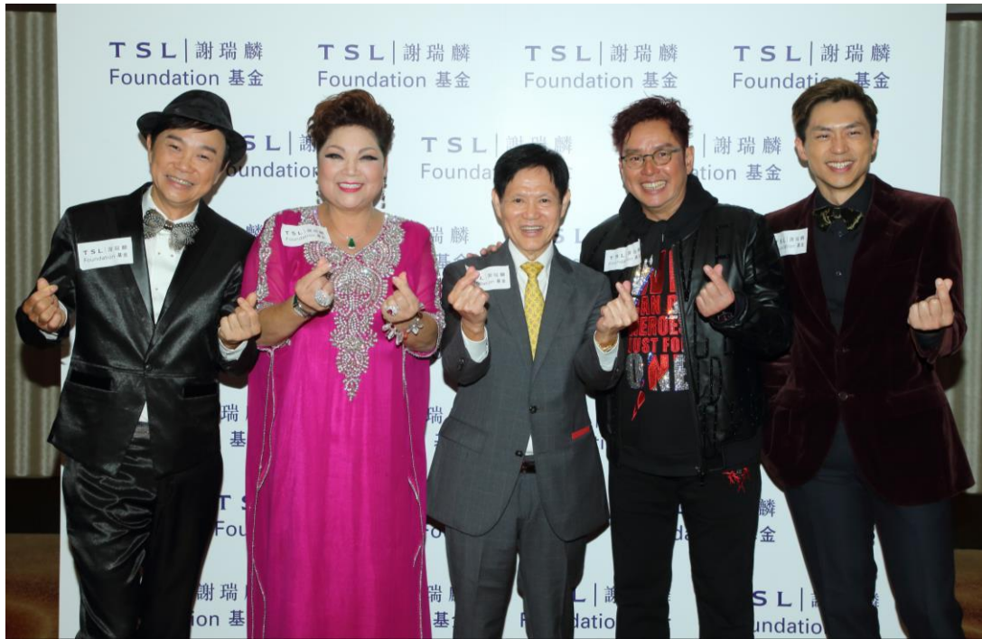
一眾歌影視紅星一同出席慶祝謝瑞麟先生八十壽辰