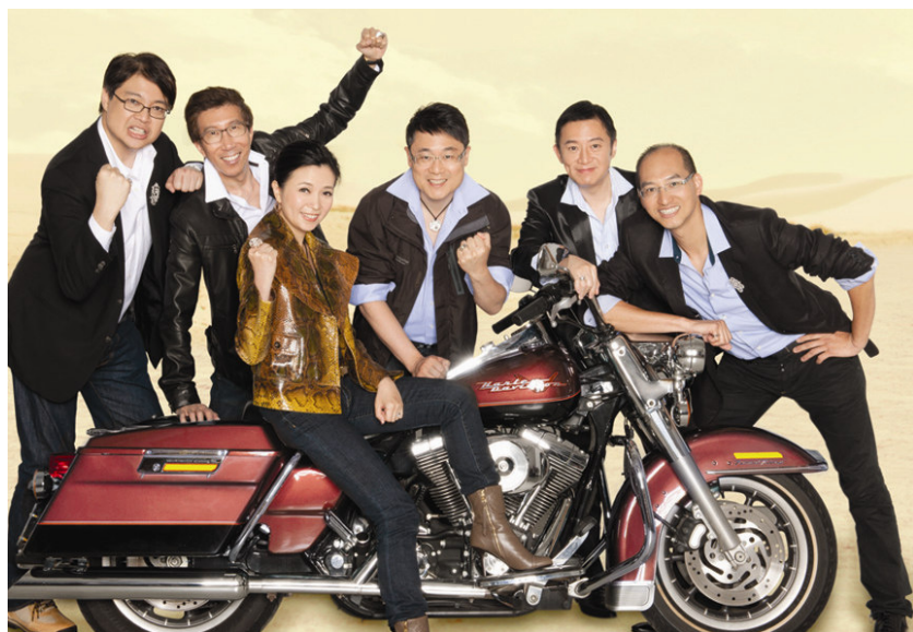
集團董事會成員 及 集團高層管理人員合照