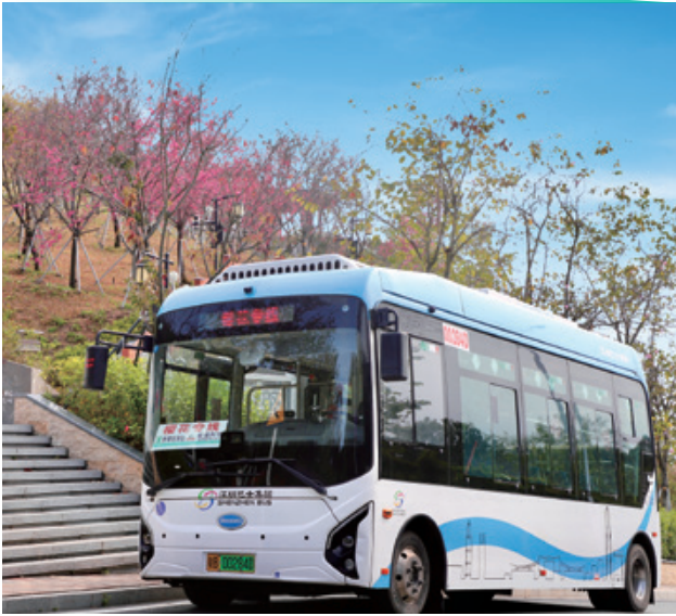
◉ 深圳巴士集團是全球最大的新能源公共交通運輸營辦商之一