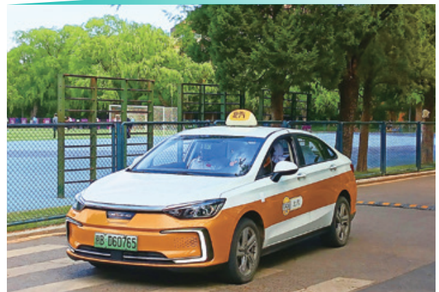
◉ 北汽九龍營運一支擁有超過4,900部計程車的車隊

北汽福斯特擁有超過1,000部車輛，主要在北京和天津提供包車服務。至於車輛租賃服務方面，北汽福斯特充分利用商務旅客及一系列於首都舉行的活動、會議及展覽所帶來的商業機會。