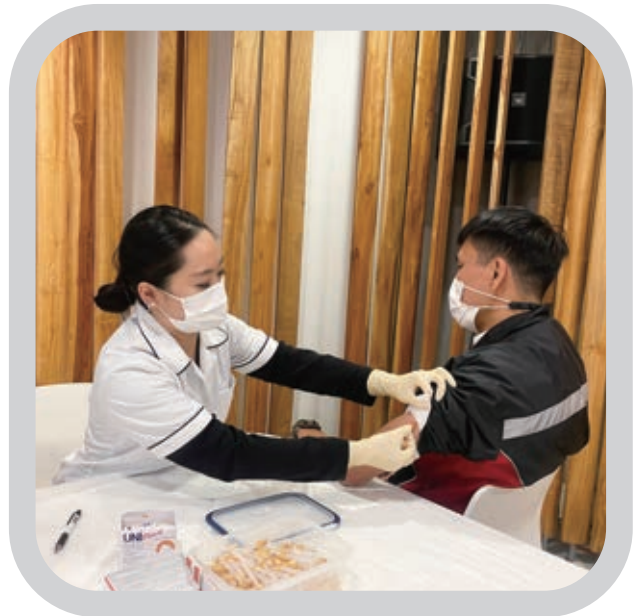
Ⓐ 九巴和龍運為旗下員工提供免費外展流感疫苗接種服務

去年，我們推出多項關愛員工的活動，得到員工熱烈的回應。其中，為培養團結、互相欣賞和支持的工作文化，我們舉辦一系列「員工感謝月」活動，包括向員工派發電子禮券和便攜風扇，並邀請管理層、前線和