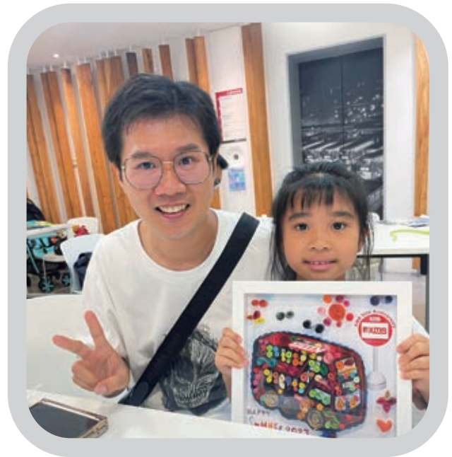
Ⓐ 九巴舉辦立體卷紙藝術班，增進員工及其子女的子關係

此外，我們也非常關心員工的精神和情緒健康，透過僱員支援計劃，為員工及其家庭成員提供保密諮詢和