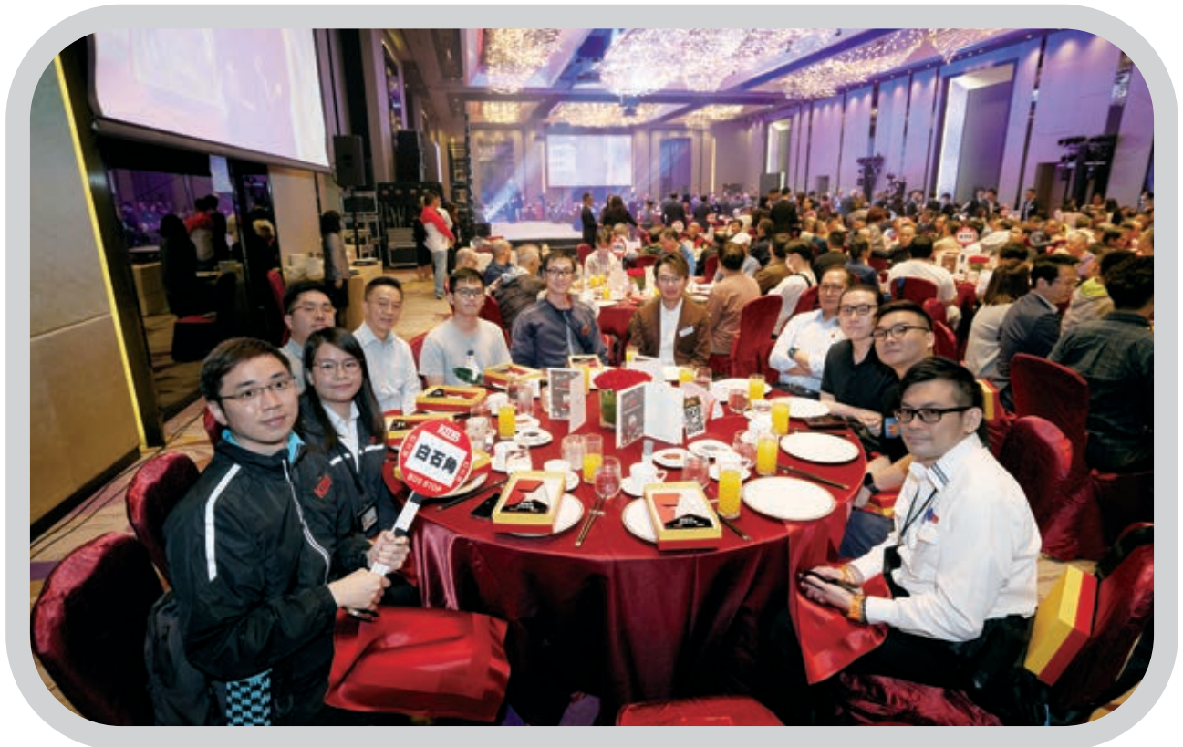
Ⓐ 為慶祝九巴成立90周年及表揚員工長期服務及表現卓越，九巴邀請員工出席晚宴及頒獎禮

支援服務，其中包括提供24小時危機支援、短期諮詢服務，以及轉介心理健康專業人員等服務。