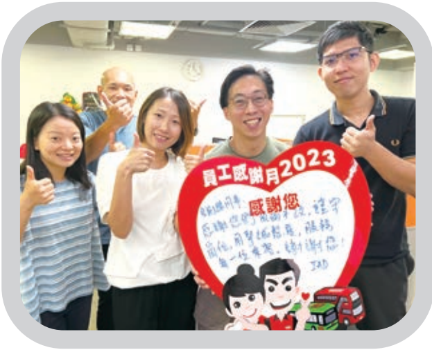
Ⓐ 透過舉辦「員工感謝月」活動，以培養員工團結、互相欣賞和支持的工作文化