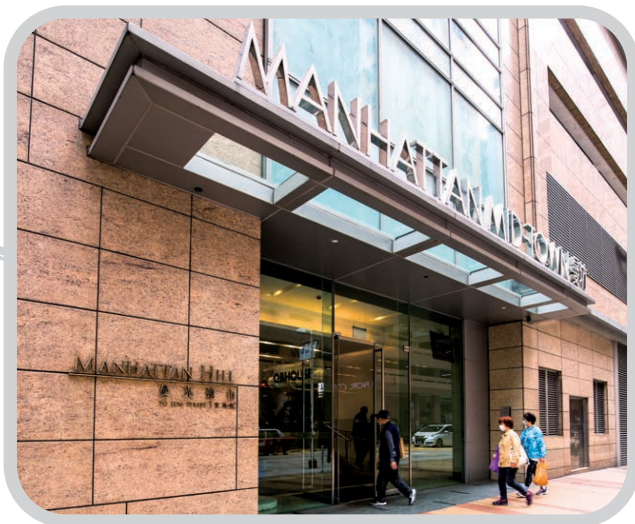
ⓐ 位於荔枝角的高級平台商場「曼坊」，商場全部可出租樓面面積已租出，為集團帶來經常性租金收入