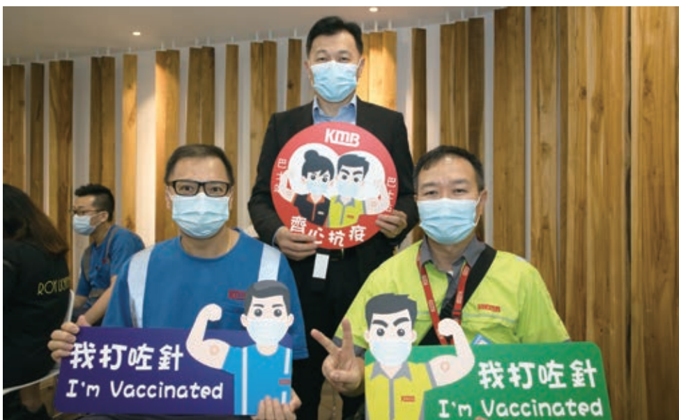
為保護員工及其家屬，九巴及龍運安排政府外展疫苗接種隊，於車廠提供2019冠狀病毒疫苗接種服務

我們經常提醒員工要遵守人力資源政策，此外設有完善的投訴處理機制，一旦接獲投訴，會對所有投訴作出全面調查，並採取適當的行動。視乎個案的嚴重程度，可能會成立特設委員會調查有關個案，如有違規會作出嚴肅的紀律處分，包括即時解僱。