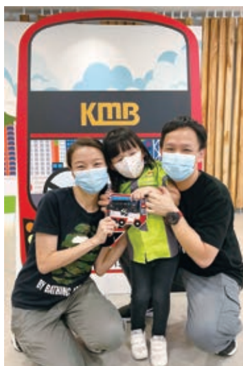
九巴及龍運舉辦運動比賽及親子活動，促進員工工作與生活平衡