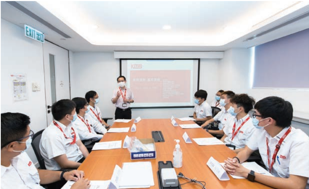
為提升處理緊急交通事故時的知識及技巧，公司為車務督察舉辦培訓課程

九巴及龍運管理層於年內到巴士總站、車廠及辦公室探訪，鼓勵員工並聆聽他們的意見。探訪活動為員工提供良好機會，就營運事項及與工作環境相關的事宜向管理層表達意見。