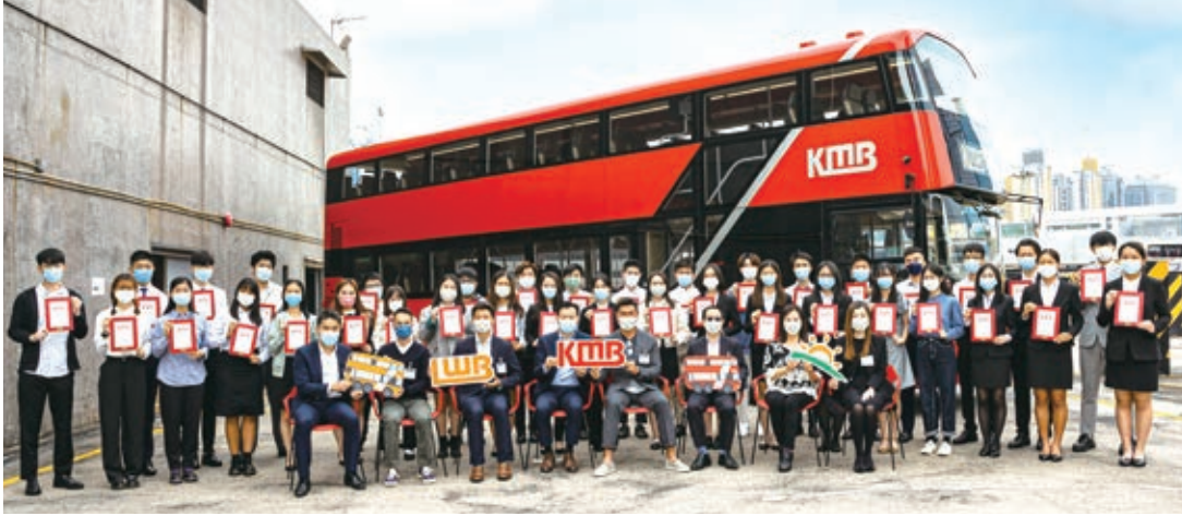
九巴及龍運為員工子女設立獎學金計劃，迄今已有超過370名員工子女受惠