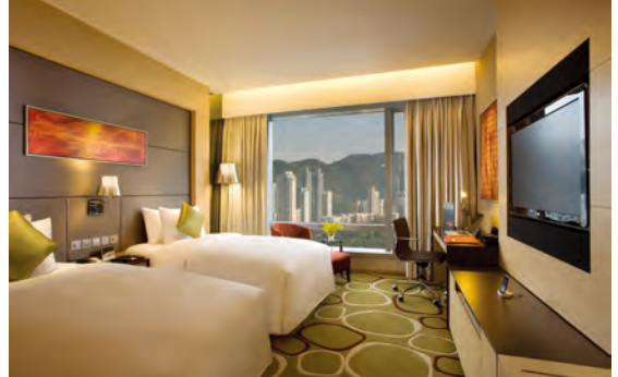
香港銅鑼灣皇冠假日酒店

於本期間，本集團在高息環境及經濟低迷下繼續維持高度財務靈活性及流動性。隨著香港政府取消所有樓市收緊措施，維港滙展現強勁的銷售勢頭，令本集團持續地從該項目收取可觀的現金回報。本集團來自其他投資項目及酒店的穩健現金流進一步加強我們降低資產與負債比率及融資成本的能力。展望未來，本集團預期於二零二六年前不會有重大的再融資需求。此等因素表明本集團具備充足的財務靈活性及流動資金。