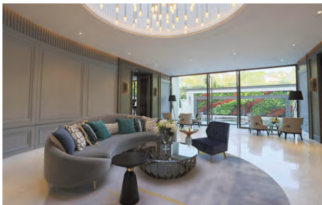
香港壽臣山道東1號