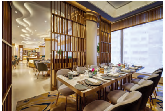
香港銅鑼灣皇冠假日酒店