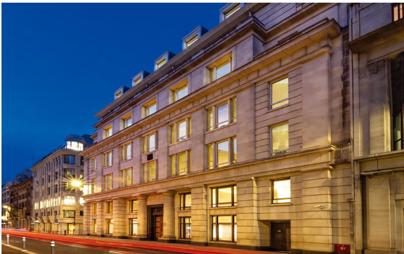
倫敦 20 Moorgate