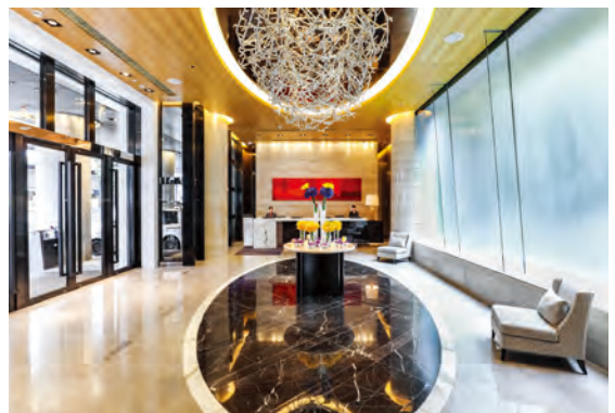
香港銅鑼灣皇冠假日酒店