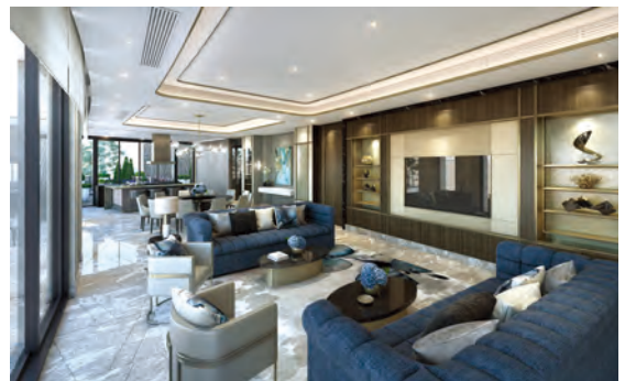
香港壽臣山道東 1 號

外部情勢依然複雜，地緣政治緊張局勢持續影響貿易和金融流動，可能擾亂全球供應鏈。儘管如此，全球經濟在過去數月展現韌力，在通貨膨脹逐漸回到目標水平的情況下，仍維持穩定增長。儘管減息時間與幅度仍不確定，市場普遍認為美國聯邦儲備局將於今年開始減息。雖然預期高息仍會持續，但轉向降息的趨勢將改善全球經濟氣氛。根據國際貨幣基金組織二零二四年七月的《世界經濟展望》，預測二零二四年全球經濟增長為 3.2%，二零二五年則為 3.3%。