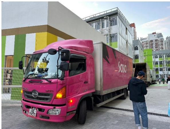
「莎莎有心人义工队」到大埔「乐善村」过渡性房屋送赠物资给受影响的居民。