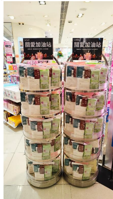
莎莎大埔太和广场分店在火灾后翌日设立「关爱加油站」。