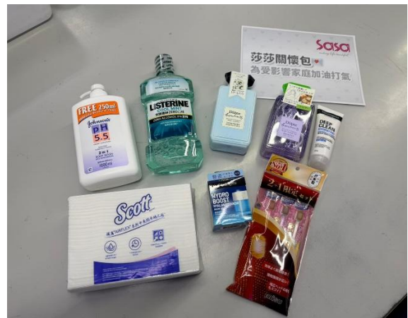
莎莎衷心感谢品牌合作伙伴对香港的关爱及支持，让物资能够及时送到受影响的居民手上。