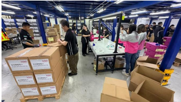
「莎莎有心人义工队」连日赶工准备「关爱包」，向大埔受影响的居民送暖。