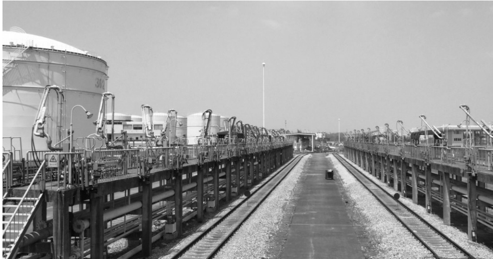
圖中顯示產品透過連接至儲油罐之管道於火車上裝載之位置。