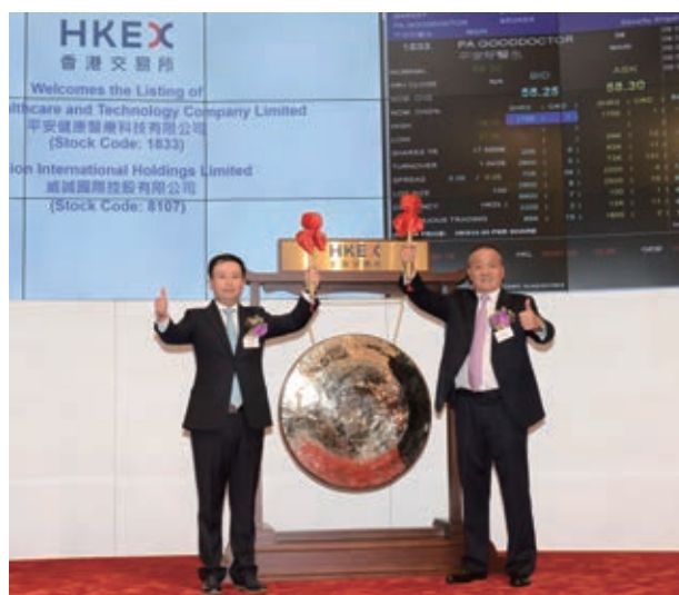
2018年5月4日，平安健康醫療科技有限公司（平安好醫生，01833.HK）於香港聯交所正式上市。

我們持續深化「金融+科技」、探索「金融+生態」的戰略規劃，金融科技與醫療科技業務發展迅速，上半年實現營運利潤46.07億元，在集團營運利潤中佔比7.0%，同比提升6.4個百分點。平安好醫生在香港聯交所主板上市；平安醫保科技於年初完成11.5億美元融資，投後估值達88億美元；金融壹賬通上半年完成7.5億美元融資，投後估值達75億美元；汽車之家上半年市值突破百億美元，較年初增長40.0%。同時，我們通過科技平台輸出「金融服務、醫療健康、汽車服務、房產服務、智慧城市」五大生態圈，加快科技成果轉化，促進行業整體科技水平提升。