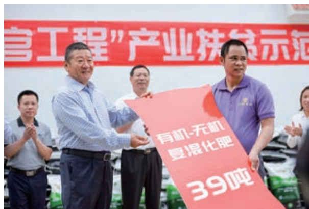
2018年5月22日，中國平安「三村工程」在廣西落地，助力偏遠貧困地區經濟和社會的發展。

不畏浮雲遮望眼，風物長宜放眼量。面對風雲變幻的全球經濟形勢，站在30年新起點，我們將繼續堅守初心，夯實金融主業，通過履行保險人的責任，幫助更多百姓承擔起對親人的關愛和責任，承擔起對未來的保障和承諾。我們將繼續回饋社會，扎實做好「三村工程」，助力美好鄉村建設。我們將用心聆聽時代心聲，積極佈局金融科技和醫療科技等創新版圖，開拓智慧城市等創新型科技服務；洞察客戶需求，做好綜合金融一站式服務，優化簡單消費體驗。推動各項業務穩健增長，持續為客戶和股東創造價值，開啟平安未來三十年輝煌新征程。