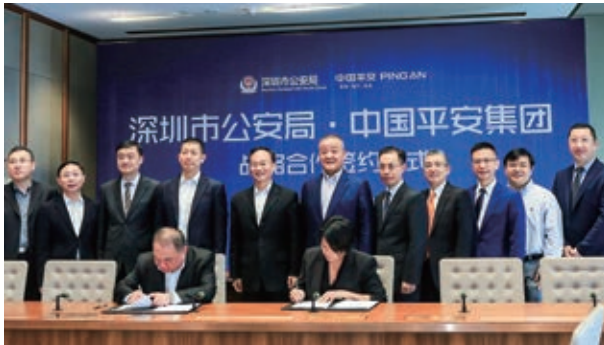
2018年4月27日，中國平安與深圳市公安局簽署戰略合作協議，攜手「智慧新警務」建設。

2018年上半年，我們邁出了新十年穩健的第一步。面對複雜多變的內外部環境帶來的諸多挑戰，平安持續深化「金融+科技」、探索「金融+生態」，取得來之不易的成績，位列《財富》世界500強第29位，首次躋身《福布斯》全球上市公司2000強第10位。