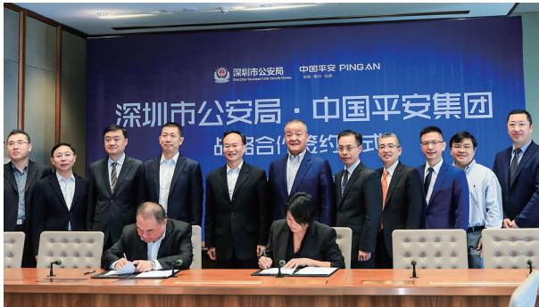
2018年4月27日，中國平安與深圳市公安局簽署戰略合作協議，攜手「智慧新警務」建設。

2018年上半年，我們邁出了新十年穩健的第一步。面對複雜多變的內外部環境帶來的諸多挑戰，平安持續深化「金融+科技」、探索「金融+生態」，取得來之不易的成績，位列《財富》世界500強第29位，首次躋身《福布斯》全球上市公司2000強第10位。