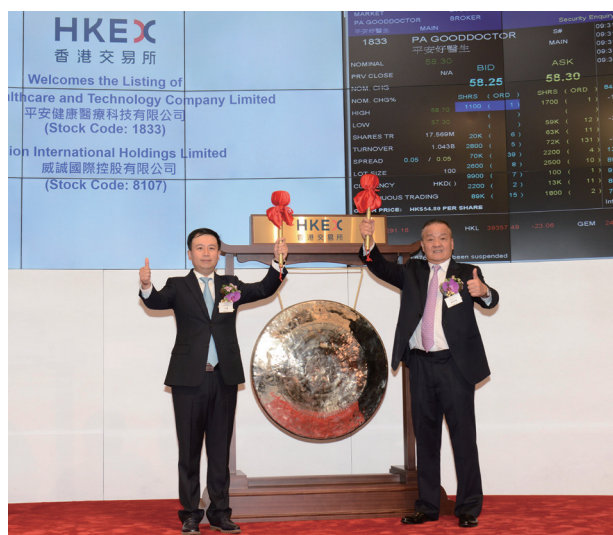
2018年5月4日，平安健康醫療科技有限公司（平安好醫生，01833.HK）於香港聯交所正式上市。

我們持續深化「金融+科技」、探索「金融+生態」的戰略規劃，金融科技與醫療科技業務發展迅速，上半年實現營運利潤46.07億元，在集團營運利潤中佔比7.0%，同比提升6.4個百分點。平安好醫生在香港聯交所主板上市；平安醫保科技於年初完成11.5億美元融資，投後估值達88億美元；金融壹賬通上半年完成7.5億美元融資，投後估值達75億美元；汽車之家上半年市值突破百億美元，較年初增長40.0%。同時，我們通過科技平台輸出「金融服務、醫療健康、汽車服務、房產服務、智慧城市」五大生態圈，加快科技成果轉化，促進行業整體科技水平提升。