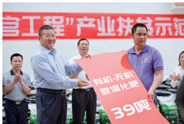
2018年5月22日，中國平安「三村工程」在廣西落地，助力偏遠貧困地區經濟和社會的發展。

不畏浮雲遮望眼，風物長宜放眼量。面對風雲變幻的全球經濟形勢，站在30年新起點，我們將繼續堅守初心，夯實金融主業，通過履行保險人的責任，幫助更多百姓承擔起對親人的關愛和責任，承擔起對未來的保障和承諾。我們將繼續回饋社會，扎實做好「三村工程」，助力美好鄉村建設。我們將用心聆聽時代心聲，積極佈局金融科技和醫療科技等創新版圖，開拓智慧城市等創新型科技服務；洞察客戶需求，做好綜合金融一站式服務，優化簡單消費體驗。推動各項業務穩健增長，持續為客戶和股東創造價值，開啟平安未來三十年輝煌新征程。