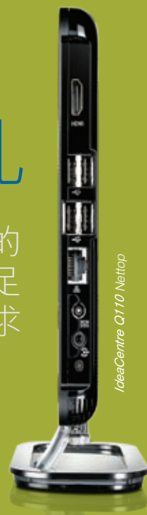
IdeaCentre Q110 Nettop