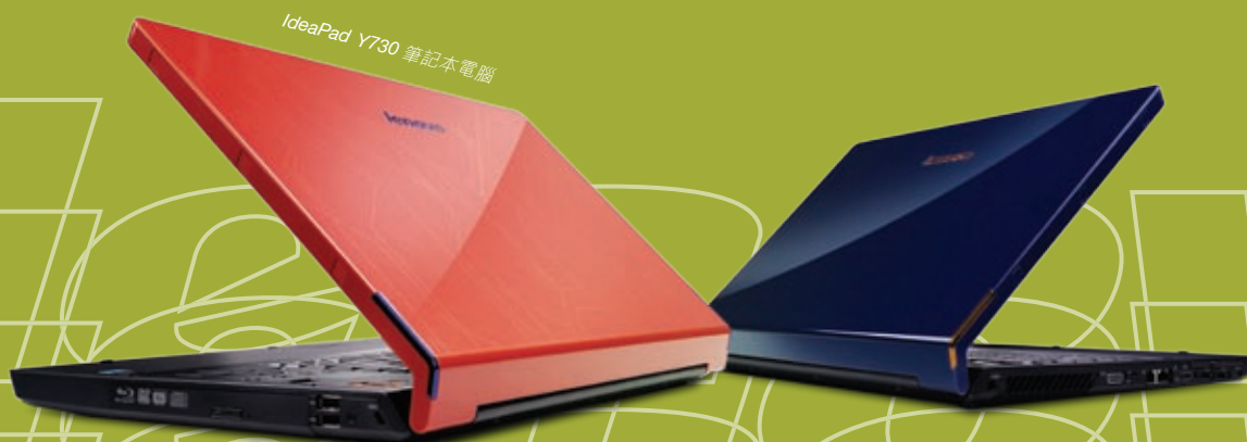
IdeaPad Y730 筆記本電腦