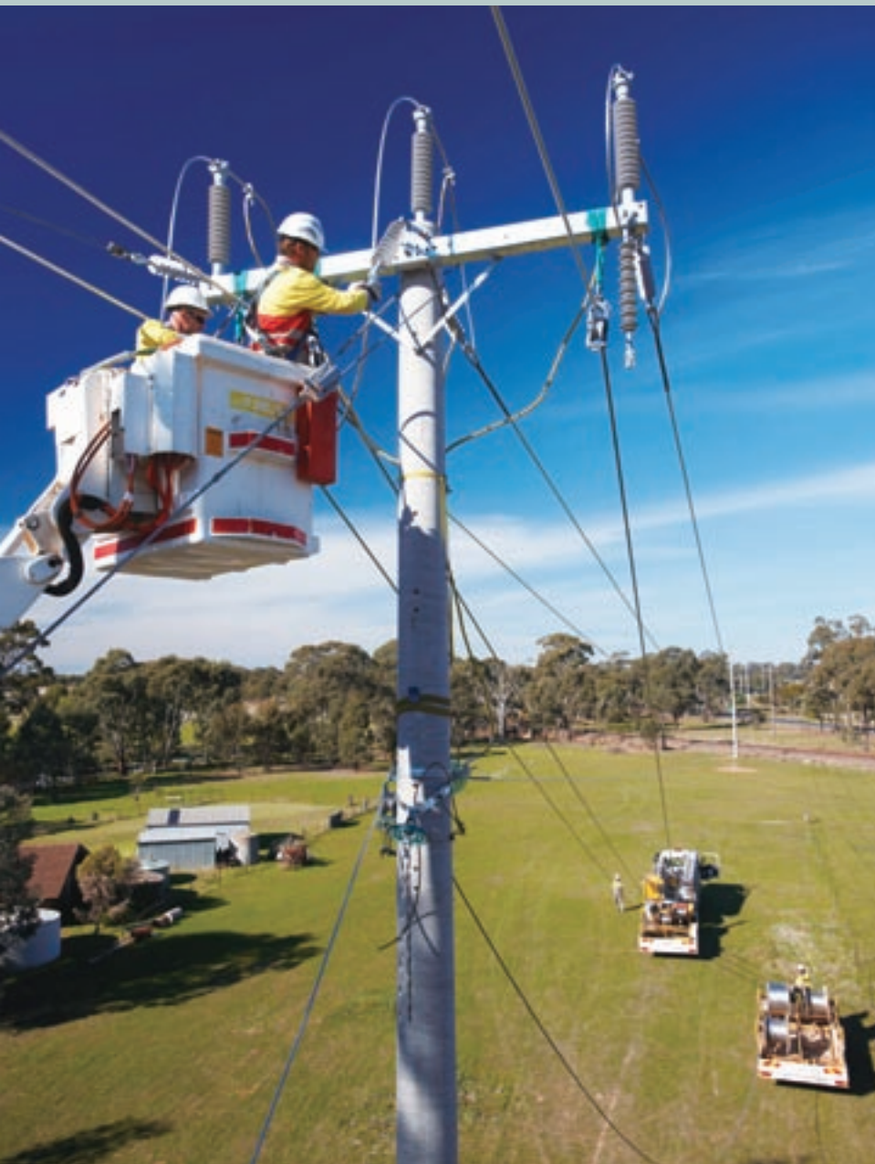
長江基建於 2013 年進一步擴展及加強其環球投資組合。