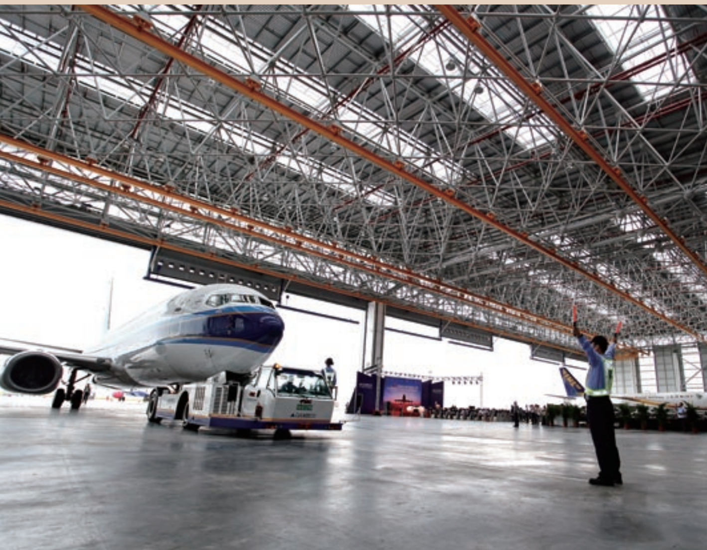
廣州飛機維修工程宣佈第二期機庫落成。