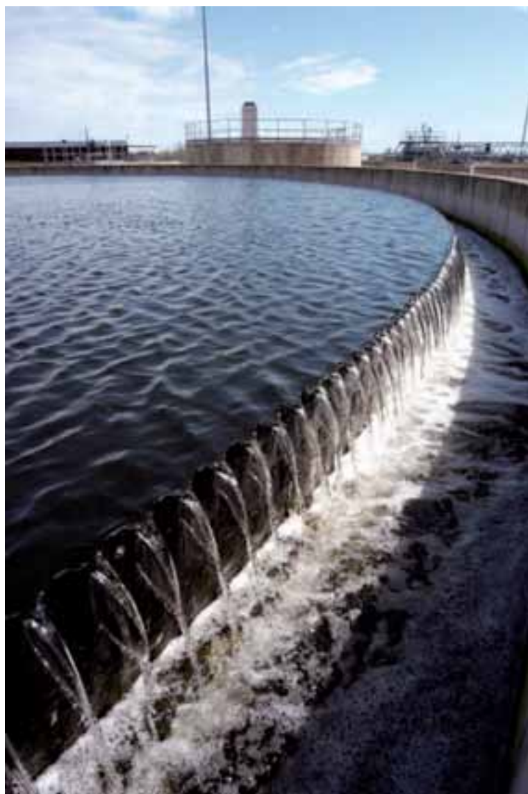
由長江基建牽頭的財團完成收購英國水務公司Northumbrian Water。

於二〇一一年八月，長江基建出售其於Cambridge Water 之全數權益，以符合英國之相關合併規定。於二〇一一年十月，長江基建於英國完成收購曾在倫敦證券交易所上市之 Northumbrian Water，該公司在英格蘭及威爾斯經營水務及污水處理業務。