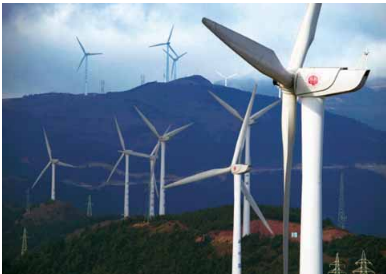
電能實業的大理風場，在中國內地獲得優質工程獎。

長江基建為香港聯合交易所有限公司(「聯交所」)最大型之上市基建公司之一，多元化投資包括能源基建、運輸基建、水務基建及基建相關業務。該公司為全球基建業之領導者之一，主要在六個地區經營，包括香港、英國、內地、澳洲、新西蘭及加拿大。