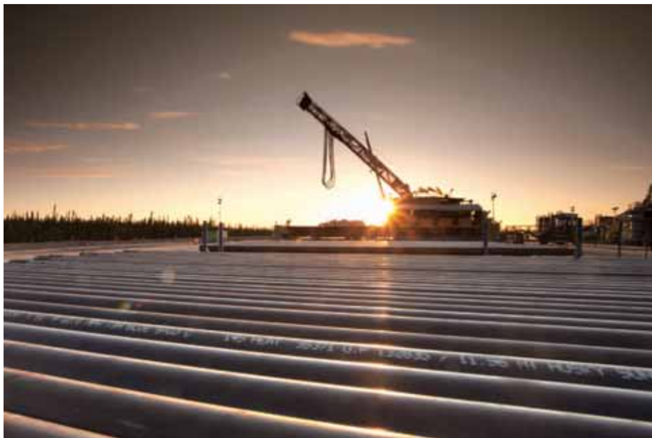
赫斯基能源於阿爾伯達省北部之旭日能源項目啟動基建工程，項目於水平井的鑽探技術，因為蒸汽輔助重力泄油技術而得以提升。

赫斯基能源公佈於二〇一一年扣除專利稅後之收益為二百三十三億六千四百萬加元，較去年上升百分之三十七，盈利淨額為二十二億二千四百萬加元，較去年增加百分之一百三十五，主要由強勁之產量增長、變現原油價格上升及精煉利潤增加帶動。赫斯基能源二〇一一年之營運現金流為五十一億九千八百萬加元，較去年增加百分之六十九。