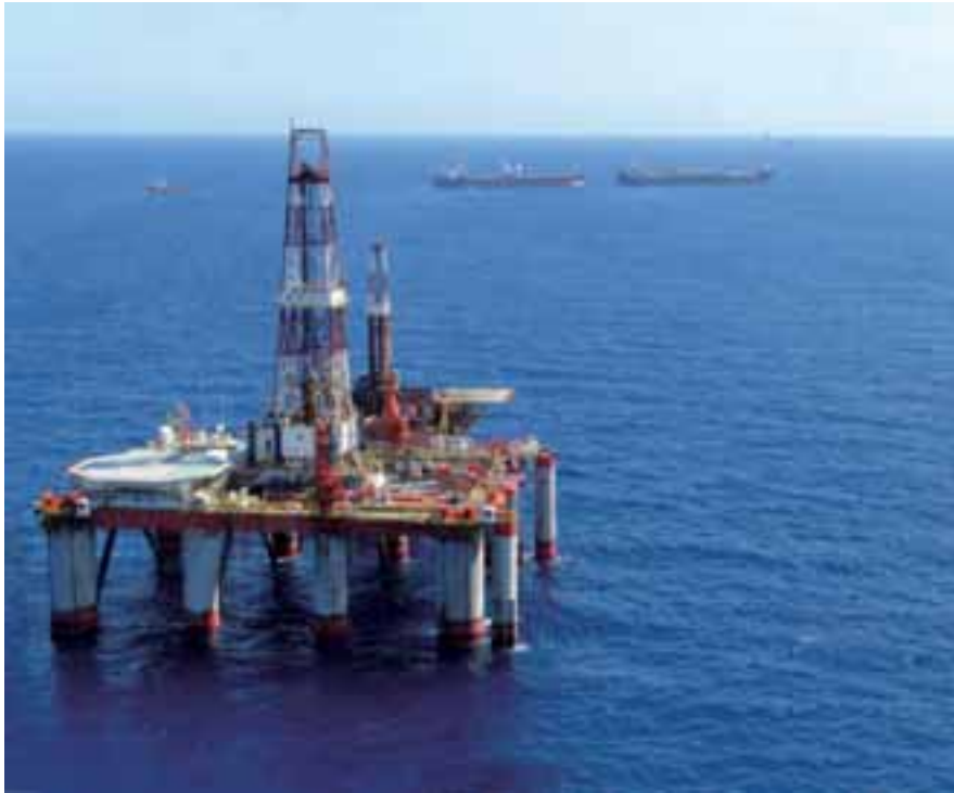
位於南中國海的文昌油田的鑽油臺與穿梭油船。

二〇一一年宣佈派發之股息總額為每股一點二加元。年內，集團獲赫斯基能源派發之現金股息達港幣六億九千二百萬元，其餘以股代息收取。集團所佔赫斯基能源之權益由二〇一〇年年底之百分之三十四點五五減至現有之百分之三十三點七八，主要由於赫斯基能源於二〇一一年發售十二億加元之普通股，其中十億加元透過公開發售普通股售出。