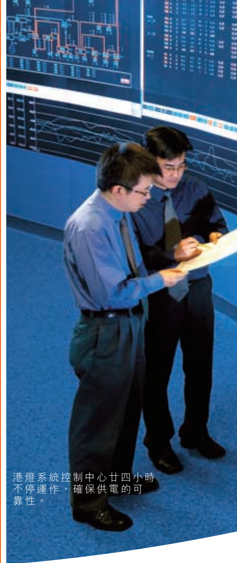
港燈系統控制中心廿四小時不停運作，確保供電的可靠性。

能源、基建、財務及投資與其他部門二〇〇六年之合計收益總額共計港幣五百七十四億一千七百萬元，上升百分之十五，主要由於集團所佔赫斯基之收益增加，以及集團之財務及投資業務取得更高收益。EBIT共港幣二百一十三億六千一百萬元，增加百分之十七，主要由於赫斯基之業績增進，以及集團庫務業務之溢利增加，但部分被長江基建之下降業績所抵銷。