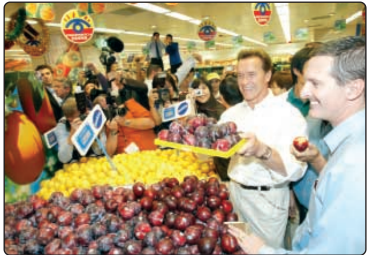
● 美國加州州長阿諾舒華辛力加到訪香港百佳超級市場，宣傳及推廣加州食品。