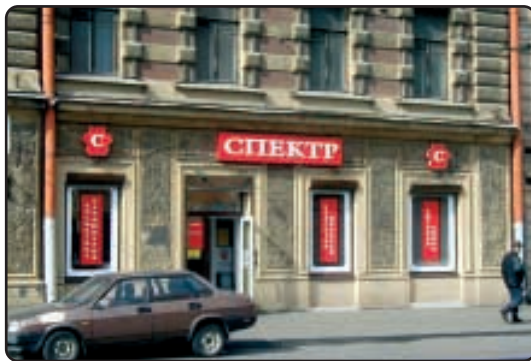
● 屈臣氏集團所收購的Spektr Group在俄羅斯聖彼得堡經營二十四間保健及美容產品連鎖店。