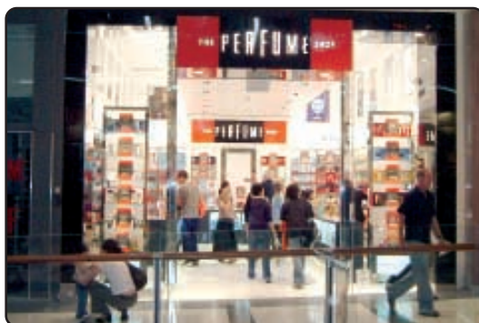
● 屈臣氏集團於二〇〇五年八月收購的The Perfume Shop在英國、愛爾蘭和澳洲經營超過一百二十家分店。

利貢獻也因而下降。在中國內地，屈臣氏的收入與EBIT均錄得強勁增長。東南亞方面，屈臣氏在新加坡、馬來西亞、泰國及菲律賓繼續開設新店，因此收入和EBIT均告上升。為進一步加強在亞洲的業務，集團於三月在南韓開設第一家店舖。集團並將版圖擴展至土耳其，收購擁有七家保健及美容產品零售連鎖店的Cosmo Shop，繼而在當地開設一家屈臣氏商店。於六月，該部門完成收購在馬來西亞擁有二十家藥房的Apex Pharmacy，並着手將上述藥房改以屈臣氏品牌經營。該部門目前在亞洲十一個市場經營逾一千三百家店舖。