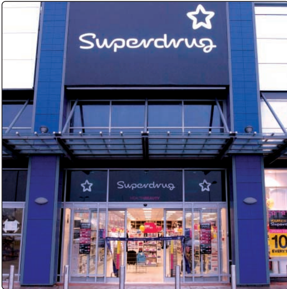
● 英國保健及美容產品連鎖店Superdrug增長迅速，積極在全國擴展分店網絡。

歐洲的保健及美容產品業務的合計收入較去年增加百分之十九，EBIT則增加百分之十八，主要因為英國的業績改善，以及各項Rossmann業務貢獻的收益增加，包括集團於二〇〇四年八月購入德國Rossmann四成權益的全年收益。儘管英國的消費意慾疲弱，但英國兩家主要零售連鎖集團透過擴大產品系列與進行推廣活動，並改善產品類別與組合以提升毛利，使合計收入與經常性EBIT分別上升百分之二與百分之十。歐洲大陸業務成功在各所在國家維持市場地位，整體收入取得百之三的增長，但EBIT貢獻則減少，主要由於保健及美容產品連鎖專門店與超級市場的激烈競爭，尤其在荷蘭。拉脫維亞與立陶宛的Drogas 連鎖集團是該部門在東歐的首項投資，