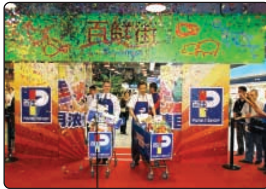
● 百佳品牌備受內地消費者信賴，其「P」字商標已成為品質可靠的象徵。