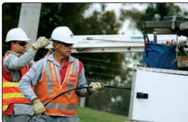
● 澳洲配電業務之一——Powercor鋪線工人完成綜合網絡保養工程其中一項工序。Powercor擁有維多利亞省最大的網絡，覆蓋該省西部百分之六十五面積，為超過六十四萬名客戶服務。

「赫斯基宣佈收入總額為一百零二億四千五百萬加元，而盈利淨額為二十億零三百萬加元，分別上升百分之二十一及百分之九十九。」