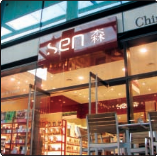
● 和記中國轄下在英國的「森」產品範圍現已擴展至美容護膚品，更提供包括按摩和針灸等服務來緩和情緒及身體微恙。