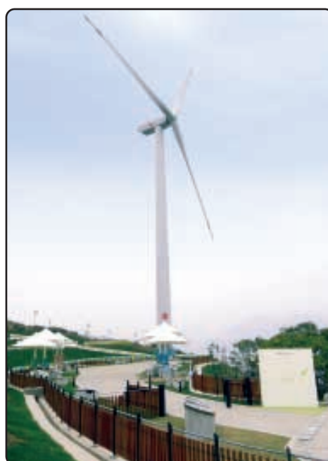
● 港燈籌建及營運的全港首個具商業規模的風力發電站「南丫風采發電站」正式投產，為香港電力發展史揭開新一頁。