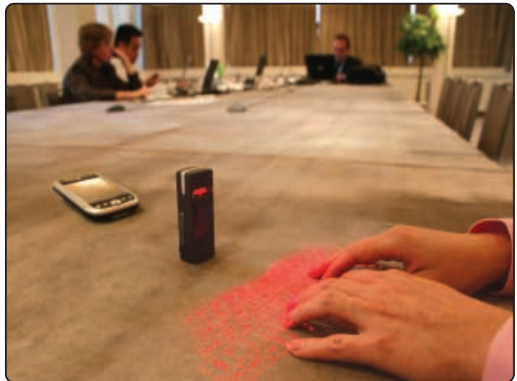
● 藍芽虛擬鍵盤是世界第一具無線虛擬鍵盤，把無線流動通訊技術帶到另一高峰。

TOM集團是集團佔有百分之二十四點五權益的聯營公司，在香港聯合交易所上市，業務包括互聯網、戶外媒體、出版、體育、電視與娛樂。TOM宣佈營業額為港幣三十一億零五百萬元，較上年度增加百分之二十。股東應佔溢利為港幣二億六千萬，上年度則為港幣七億七千三百萬元，其中包括TOM在線上市時取得的港幣九億七千九百萬元灘薄溢利。