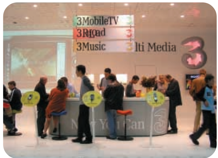
● 3 奧地利在「FunTec」展覽會上推介它的流動多媒體服務。

十二月，H3GA與Telstra Corporation（「Telstra」）簽訂一項協議，成立新的合夥公司，以持有與經營H3GA現有的WCDMA無線網絡。Telstra為換取網絡資產的一半權益，將按固定的付款時間表向H3GA支付四億五千萬澳元。協議又將惠及H3GA，因協議將分擔H3GA網絡營運及保養成本，以及將網絡擴展至H3GA並無獲得3G牌照的區域。H3GA又跟Telstra簽訂了新的全國漫遊協議，藉此把網絡的覆蓋面擴展至澳洲百分之九十六的人口。