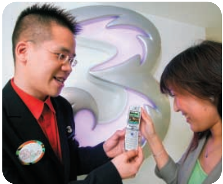
● 3 香港推出全球首創3G 流動賽馬視像直播服務。

市場對內容服務的需求持續增長，3客戶愈來愈熟悉3G非話音服務的瀏覽器介面及使用方法，而創新服務的使用量也急速增長，例如實時觀賞「Big Brother」實況電視節目和演唱會，以及下載新推出的音樂視像片段等。3英國的「Football at 5.15」在二〇〇四/二〇〇五年「What Mobile Awards」(英國流動通訊業最大型的讀者投票獎項)中獲選為英國最佳流動通訊服務。3已成為創新內容服務和3G應用的典範，更成為基本2G服務用家首選的升級服務。