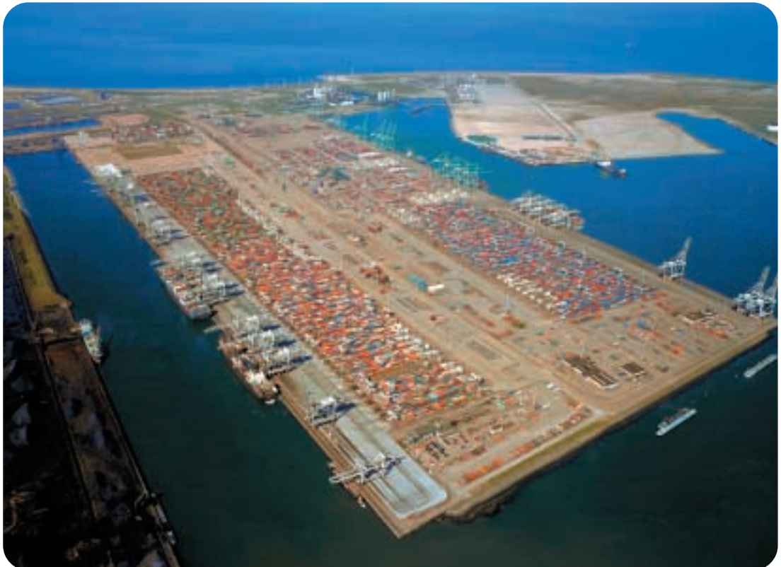
● 鹿特丹歐洲貨櫃碼頭的鳥瞰圖。