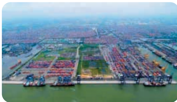
● 耶加達國際貨櫃碼頭（右）與高珈貨櫃碼頭（左）的空中俯瞰圖，兩個碼頭均座落印尼西爪哇工業中心區。

在巴基斯坦，卡拉奇國際貨櫃碼頭二〇〇四年的吞吐量較上年度上升百分之十，EBIT增加百分