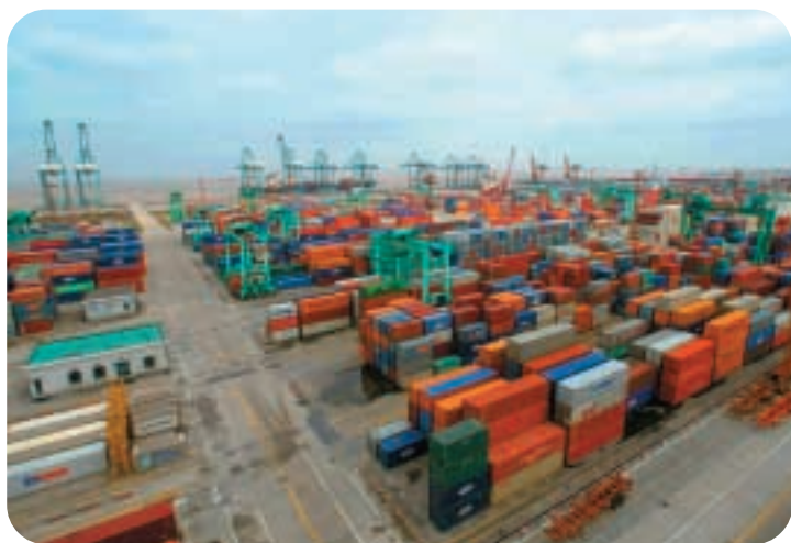
● 上海浦東國際集裝箱碼頭的貨櫃堆場。

集團於十月與泰國港務局達成一項為期三十年的協議，發展六個貨櫃碼頭。該項目共有十六個泊位，將於二〇一二年竣工。