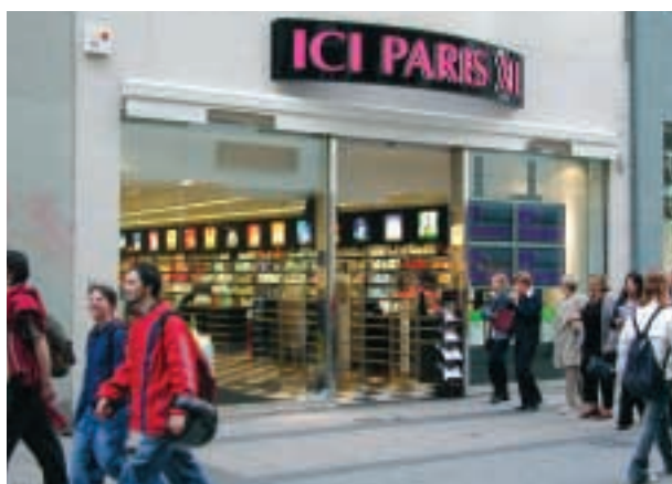
■ ICI PARIS XL 在比利時市場佔有領導地位，也是荷蘭享負盛名的香水連鎖店，每家連鎖店都採用時尚優雅的設計，發售多款名貴的香水。