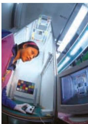
■ 和記港陸的品質檢驗員正在檢測數碼相機的製成品，確保相機的焦距調節準確無誤。