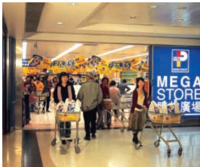
百佳超級廣場提供物超所值的多元化貨品，讓消費者享有舒適方便的購物環境。

香港百佳超級市場於二〇〇三年保持市場領導地位，並繼續開拓新領域，但銷售額與業績仍繼續蒙受通縮經濟環境與非典型肺炎的負面影響。百佳在中國內地的業務於二〇〇三年繼續擴充，表現令人鼓舞，銷售額與利息及稅前盈利均錄得增長。百佳於年內增設三家大型購物廣場，並計劃於今年開設更多同類型商店。