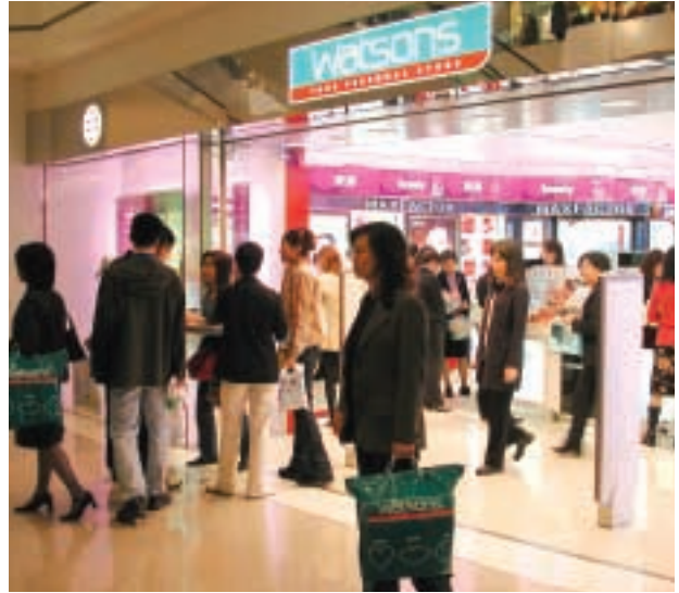
■ 屈臣氏個人護理商店在香港金鐘開設首家第三代商店；新店無論在空間運用和店面設計上都給予顧客新穎舒適的感覺。

屈臣氏又在香港與中國內地生產與分銷瓶裝水與其他飲品，和記黃埔（中國）在內地投資多項企業，至於和記港陸是著名玩具製造商，並從事優質消費電子產品與配件的設計與生產工作。零售及製造部門的總營業額為港幣六百三十億八千六百萬元，較上年度增加港幣二百三十六億一千五百萬元，增幅為百分之六十，主要由於 Kruidvat 保健與美容產品零售集團提供全年營業額貢獻（集團於二〇〇二年十月收購 Kruidvat ，而該集團旗下業務包括英國的 Superdrug ）。本年度的利息及稅前盈利為港幣二十三億零五百萬元，較去年增加百分之一百二十四（全年計算較上年度增加百分之三十五），主要由於 Kruidvat 集團，包括 Kruidvat 、 Trepleister 、 ICI Paris XL 、 Rossmann 與 Superdrug 提供溢利貢獻，而集團與內地寶潔集團的合資項目、在亞洲的其他原有業務和英國的 Savers 的業績也有改善。