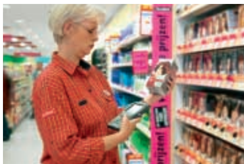
■ Kruidvat 的員工廣泛使用手提電子儀器查看貨物流轉的情況。

和記港陸有限公司 (「和記港陸」) 在聯交所上市，集團持有該公司百分之六十一點九七權益。該公司是著名的玩具製造商兼消費電子產品供應商與製造商，並於中國內地持有多項投資物業。和記港陸宣佈營業額(包括所佔聯營公司營業額)為港幣二十二億零八百萬元，股東應佔溢利為港幣一億二千八百萬元，分別增加百分之十八與百分之三十，主要由於消費電子產品(如手機配件)的銷售額上升。