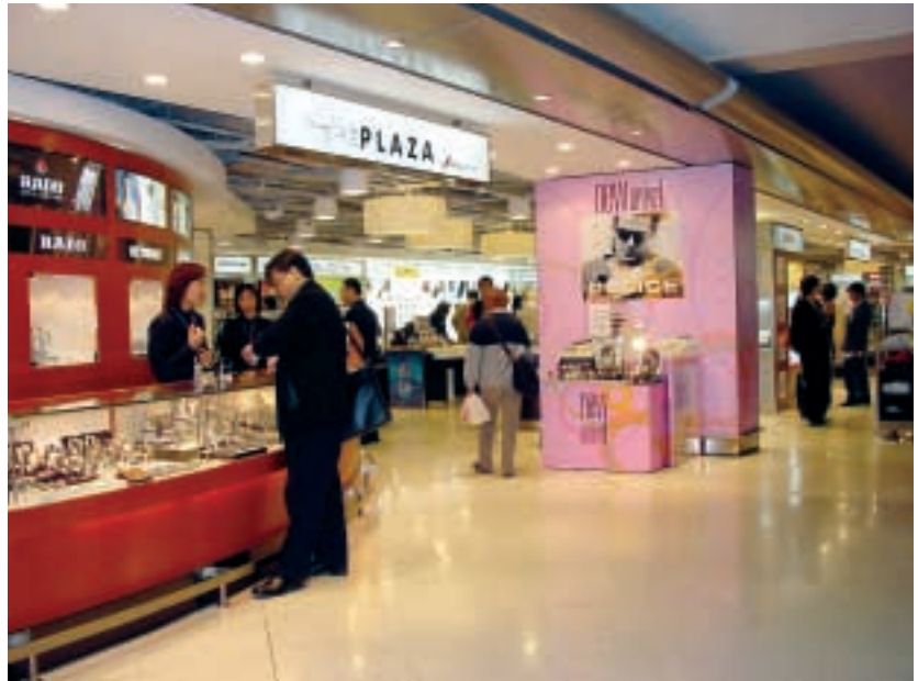
■ The Plaza 位於香港國際機場東翼，是Nuance-Watson(HK)在香港最大的店舖。

Nuance-Watson是集團與Nuance International Holdings各佔一半權益的合資公司，在香港國際機場與新加坡樟宜機場擁有零售專營權。由於二〇〇三年上半年非典型