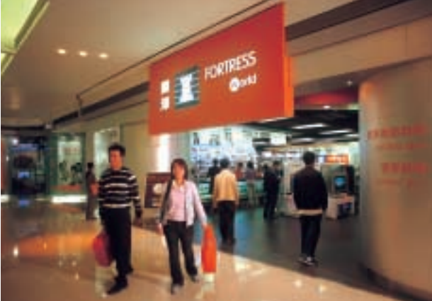
■ 豐澤推出新豐澤概念，商店設計、陳設模式、產品類別和客戶服務都讓消費者有耳目一新的感覺。

豐澤是香港一家專門售賣電子與電器用品的零售連鎖店，由於受非典型肺炎的影響，該公司二〇〇三年的業績較上年度為低。於二〇〇三年下半年，豐澤的新管理人員重新包裝公司品牌，注入全新業務元素，令公司在下半年的表現有所改善。