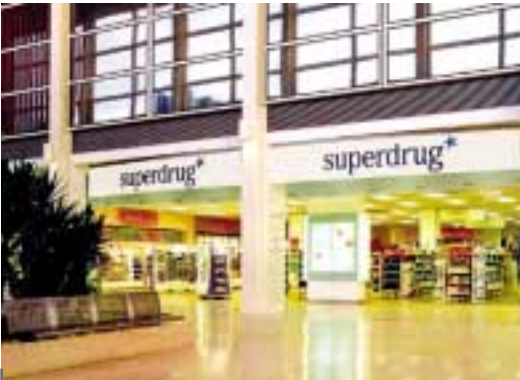
Superdrug是英國第二大的保健及美容產品零售連鎖店，共有逾七百間店舖。

香港之銷售額與去年相若，因成本控制得宜，「利息及稅前盈利」錄得增長。在中國內地，屈臣氏之銷售額與「利息及稅前盈利」分別增加百分之三十一與百分之一百四十五，主要因國內開設八間新店，繼續發展業務。於東南亞方面，屈臣氏在新加坡、馬來西亞與泰國開設新店，銷售額錄得百分之十三增長，而「利息及稅前盈利」亦較上年度上升百分之三十八。在英國，Savers於年底之店舖數目由五十六間增至二百九十多間，銷售額與「利息及稅前盈利」分別上升百分之三十四與百分之二十九。集團於二〇〇二年十月收購