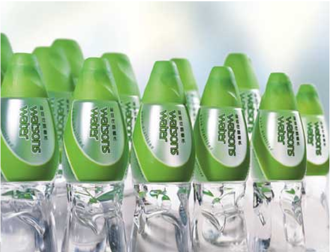
屈臣氏蒸餾水在二〇〇二年推出新裝，贏得多個業內獎項。

年相若，惟合計「利息及稅前盈利」大幅下降，主要由於各市場之價格競爭激烈、歐洲天氣惡劣，以及香港與歐洲經濟放緩所致。集團於二〇〇三年一月簽署協議，以約五億六千萬歐羅之代價，出售歐洲之瓶裝水業務予Nestlé Water，惟須待取得有關批准方可作實。該項交易預期於今年稍後完成，溢利將於屆時入賬。歐洲保健及美容產品零售業務正迅速擴展，出售瓶裝水業務後，屈臣氏將可更專注發展此方面之業務。