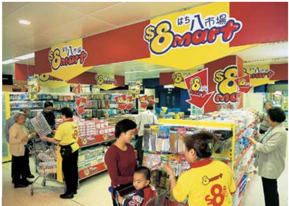
百佳超級市場在二十五間分店推出「八市場」，甚受街坊歡迎。

Kruidvat集團。該集團為歐洲主要保健及美容產品連鎖集團，在歐洲六個國家經營五項連鎖業務，約有一千九百間零售店，包括英國之保健及美容產品連鎖店Superdrug；荷蘭與比利時之Kruidvat；荷蘭之Trekpleister；捷克、波蘭與匈牙利之Rossmann，以及荷蘭與比利時之香水連鎖店Ici Paris XL。Kruidvat集團即