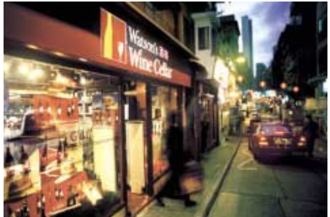
左：屈臣氏是台灣最大規模的保健及美容產品零售連鎖店，共有二百二十多間店鋪。 右：屈臣氏酒窖獲雜誌選為「最佳餐酒商舖」。

時為集團作出貢獻，提供兩個月之盈利與現金流量。此項收購大大加強屈臣氏在歐洲之實力，預期可產生協同效益，尤其對亞洲與歐洲業務之採購工作更有裨益。