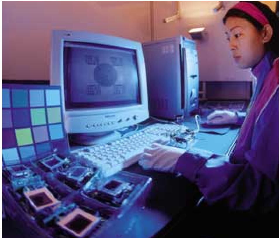
和記港陸的一名技術員正在調校數碼相機中之精密配件CMOS感應器。