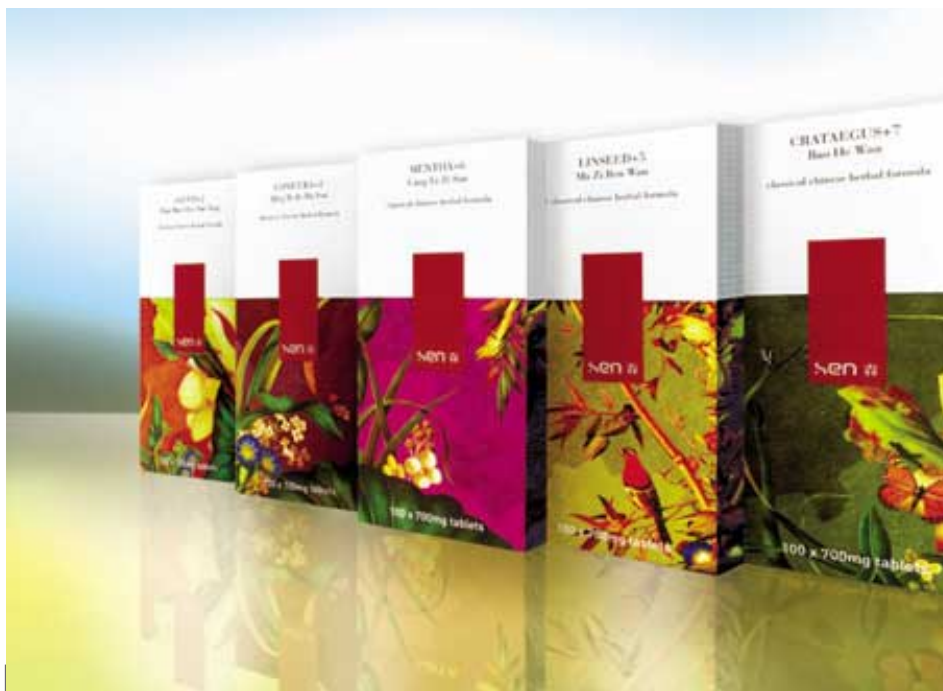
和黃在英國出售的Sen傳統中藥保健產品裝璜典雅，甚受西方顧客歡迎。

和黃中國繼續發展合資保健業務。其中之和黃健寶保健品有限公司總部設於廣州，在內地製造及分銷保健產品，集團佔百分之八十權益。此外上海和黃藥業有限公司在內地生產與分銷傳統中藥產品，集團佔百分之五十權益。於二〇〇二年十一月，集團在英國開設首間零售店，嘗試在當地推出「Sen」品牌之傳統中藥產品。