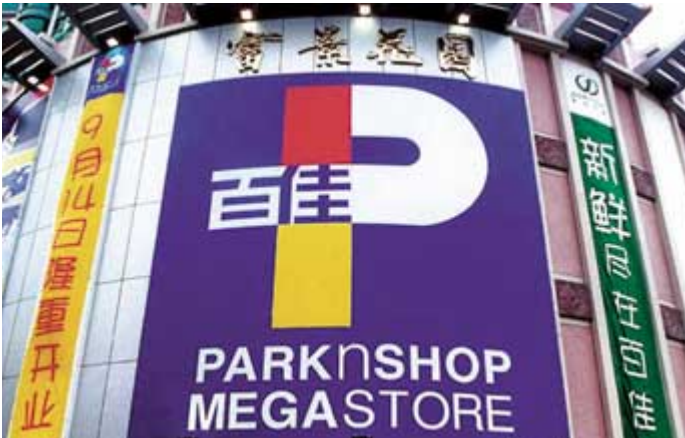
百佳超級市場的大型購物商場在國內極受歡迎。廣州海珠區富景花園的百佳超級廣場是百佳在內地最大的分店，店舖面積二十多萬平方呎。