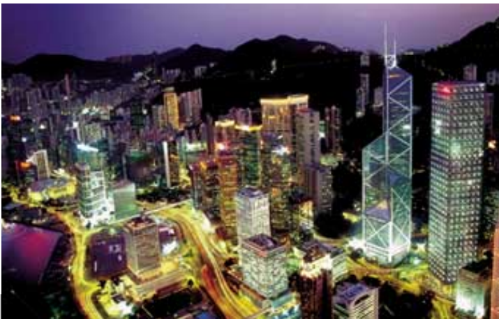
香港電燈為港島提供穩定可靠的電力供應，令這顆東方之珠璀璨生輝。

於二〇〇二年底，赫斯基能源有已探明之原油、天然凝析油及天然氣總蘊藏量九億一千八百萬桶石油當量，而截至二〇〇二年十二月止三個年度之石油生產排替率（包括收購及出售）為百分之一百三十六。赫斯基能源擁有大量海洋開發與勘探機會，亦是加拿大東岸海洋 Jeanne d'Arc 盆地之最大開採權投資者之一。在加拿大西部，該公司亦持有其中一幅最大、開採權益最高之未鑽探土地，覆蓋七百八十萬英畝淨面積之未開發土地，並於南中國海之海洋擁有發展及勘探之機會。