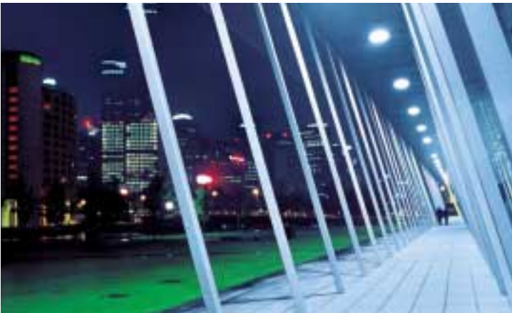
CitiPower為墨爾本中心商業區及近郊地區的約二十六萬五千用戶提供約五十三億兆瓦的電力。