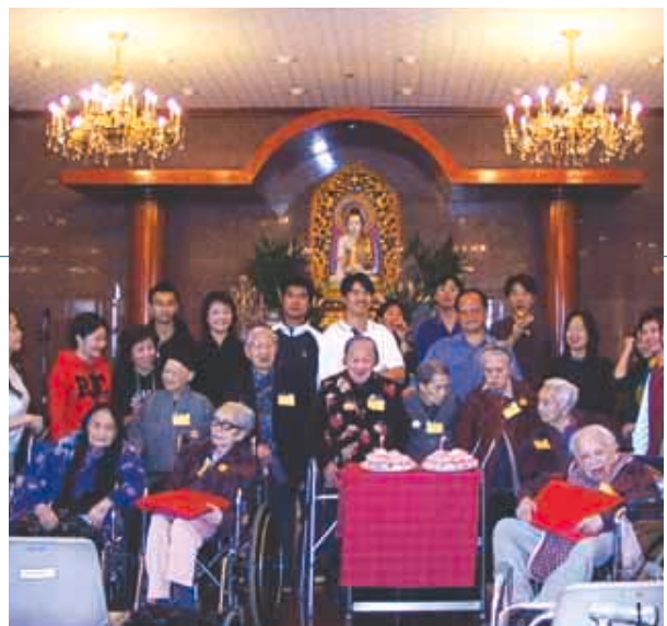
和黃義工隊經常探訪各個慈善團體。

集團在二〇〇一年度取得之業績，反映年度內香港及東南亞經濟放緩，全球進出口貿易下降，以及由美國經濟政策帶動之利息率急劇下調之形勢。此外，股市亦於二〇〇一年連續第二年大幅波動及下滑，特別是在電訊業範圍。儘管面對挑戰性環境，集團業績依然良好，各項經常性業務均錄得較佳之表現，而且集團亦能把握時機，出售在VoiceStream之投資而獲利。