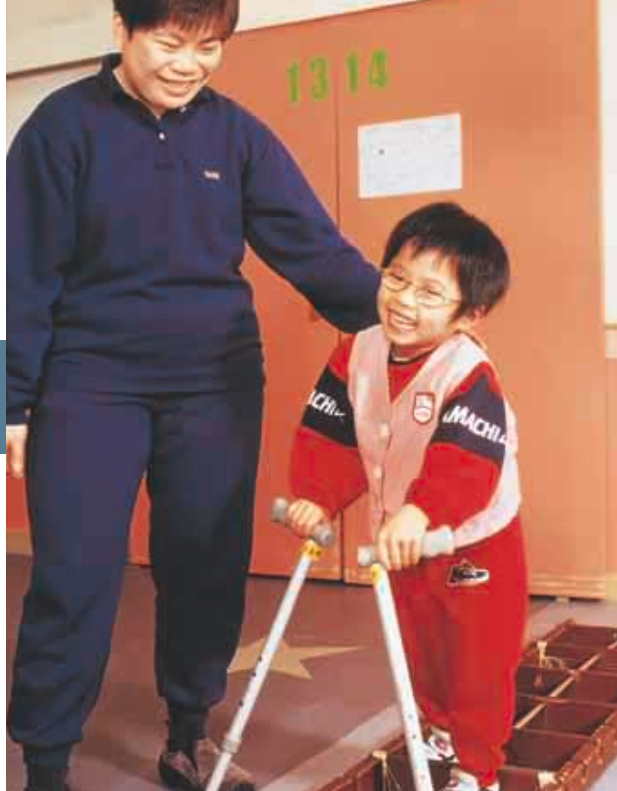
集團每年捐款予香港公益金，幫助許多有困難和有需要的人士。

集團特別著重對教育及專業機構之資助，當中包括捐款予香港中文大學、美國史丹福大學、香港教育工作者聯會及 Hong Kong Surgical Forum Trust Fund 等，支持多項由數學以至中西醫學等不同範疇之研究計劃，同時亦支持扶助弱勢社群之外展計劃。