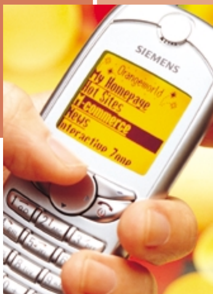
和記電訊推出Orangeworld是一項重要的策略性行動，藉此帶領香港流動互聯網服務。

由於預計香港將於今年稍後發出3G牌照，集團已參與政府之諮詢程序，現正計劃申請競投有關牌照。集團於今年二月簽訂協議，向摩托羅拉收購和記電話百分之二十五點一股權，使集團在和記電話之權益由百分之五十五點九增至百分之八十一。