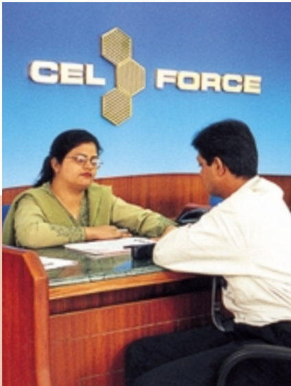
集團以CelForce為商標在古吉拉特邦推出的電訊業務，是印度大城市範圍外最大規模的手提電話業務。