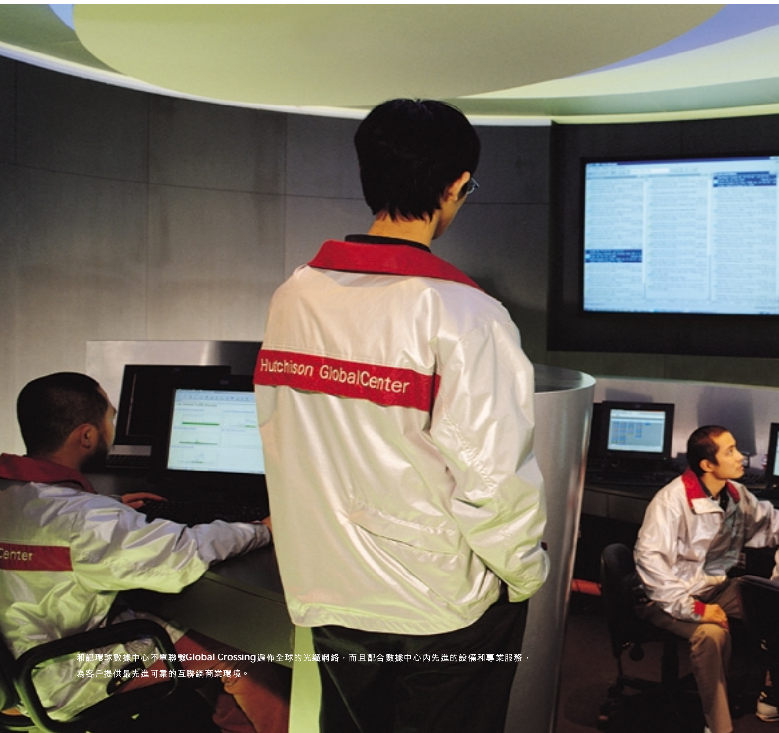
和記環球數據中心不單聯繫Global Crossing遍佈全球的光纖網絡，而且配合數據中心內先進的設備和專業服務，為客戶提供最先進可靠的互聯網商業環境。