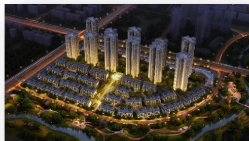
花样年 · 成都香门第

(2017年8月7日 - 香港) 花样年控股集团有限公司 (港交所股份代号：1777) 在香港公布2017年7月份销售业绩，集团附属公司深圳市花样年地产集团有限公司于7月实现房地产业务合同销售面积93,715平方米，实现合同销售金额约人民币7.02亿元。2017年前7月累计合约销售面积735,156平方米，合约销售金额人民币57.55亿元，完成2017年人民币150亿销售目标的38.4%。