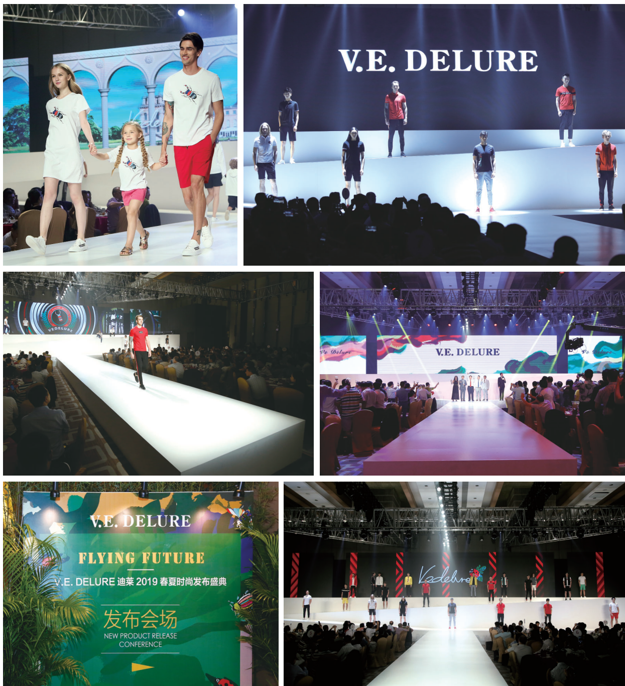
* 迪萊二零一九年春夏新品時裝發佈會