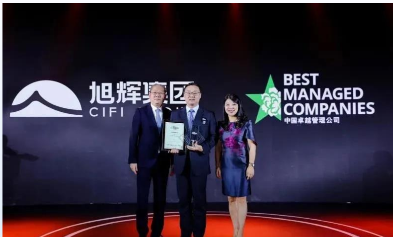
旭輝獲評“2020年度中國卓越管理公司”頒獎現場