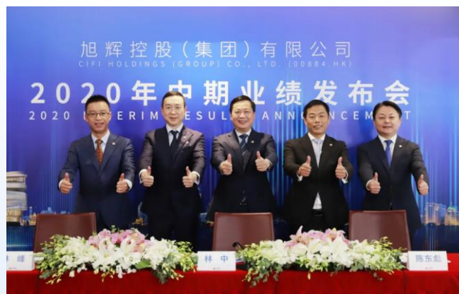
2020年中期業績發布會現場合影