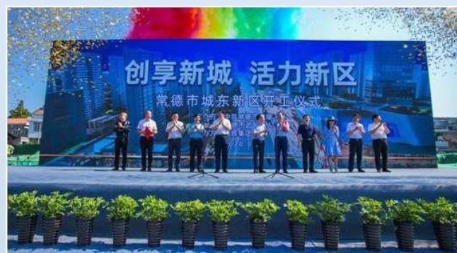
常德市城東新區啟動區項目開工儀式