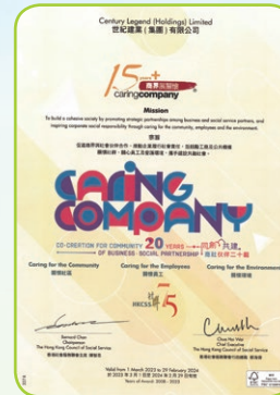
15年+「商界展關懷」標誌