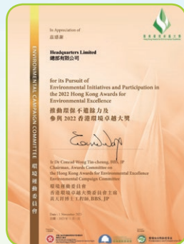
香港環境卓越大獎—感謝狀