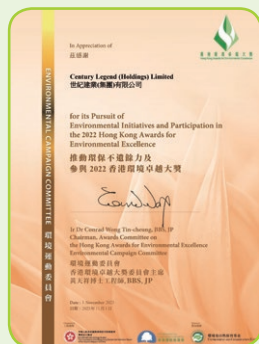
香港環境卓越大獎—感謝狀