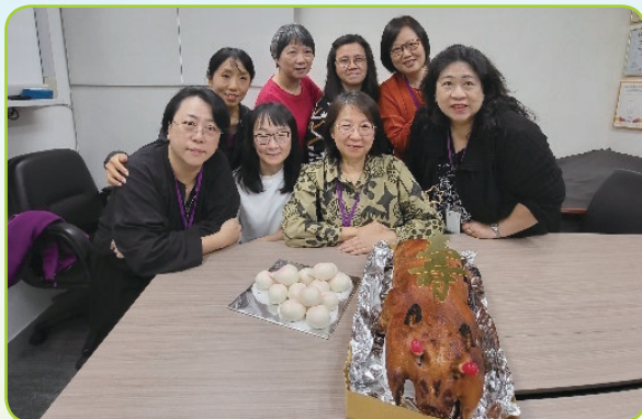
員工生日慶祝活動

此外，本集團不斷安排不同的內部活動，以在我們的員工中培養堅定的團隊精神和歸屬感。我們定期舉辦年會、生日派對、燒烤聚會、節慶午餐、義工服務、聖誕派對等活動。