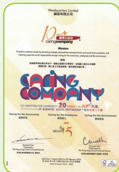
10年+「商界展關懷」標誌