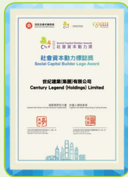
社會資本動力標誌獎