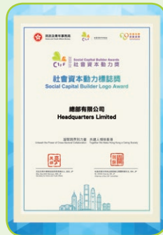
社會資本動力標誌獎