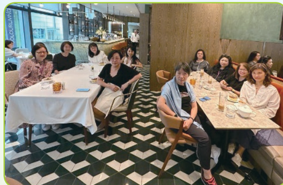
公司午餐聚餐活動