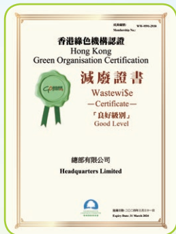
減廢證書—「良好級別」