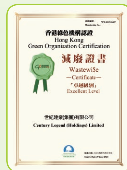
減廢證書—「卓越級別」