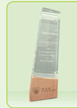
保良局義工嘉許獎盃