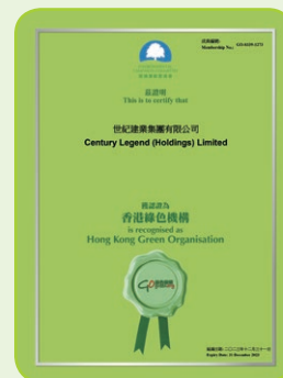
香港綠色機構認證