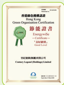
節能證書—「良好級別」