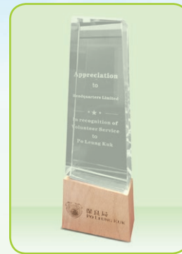
保良局義工嘉許獎盃