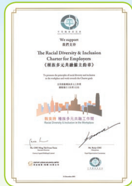
種族多元共融僱主約章