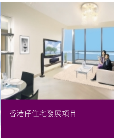
香港仔住宅發展項目