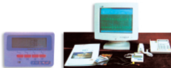
微型智能心電監護系統—生命卡

本集團於上一財政年度末初次投資於生物科技公司後，亦進一步投資於以下醫藥保健範疇：(i) 為北京醫科大學之研發項目提供商業贊助，研究減低血液脂肪水平及提升運動員表現之運動及糖尿病飲料。研究仍處於起步階段，預期將須進行三年研究，製成品方可作商品銷售；(ii) 於亞洲分銷一套保健系統，利用已取得專利之超幼細納米微粒噴霧療法，將水溶性之保健物質（例如礦物質、維他命）滲透入人體各個細胞，使每個細胞均充滿生機，減慢衰老過程。進入中國市場之計劃現正進行中。