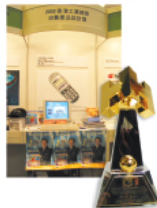
2002 香港工業總會消費產品設計獎

本集團擁有 32% 權益之創業板上市科技投資九方科技控股有限公司（「九方」）憑著其新開發之九方文字輸入系統英文版，再次榮獲二零零二年香港工業總會消費產品設計大獎。九方已與職業訓練局訂立協議，將九方中文輸入法列為香港僱主認可技能之一。包括香港諾基亞有限公司等之多間流動電話製造商已於二零零二年九月起開始生產配備九方輸入法之電話。九方將向該等電話製造商收取特許費用。在山東省，九方文字輸入系統更被列為中小學之教學工具。