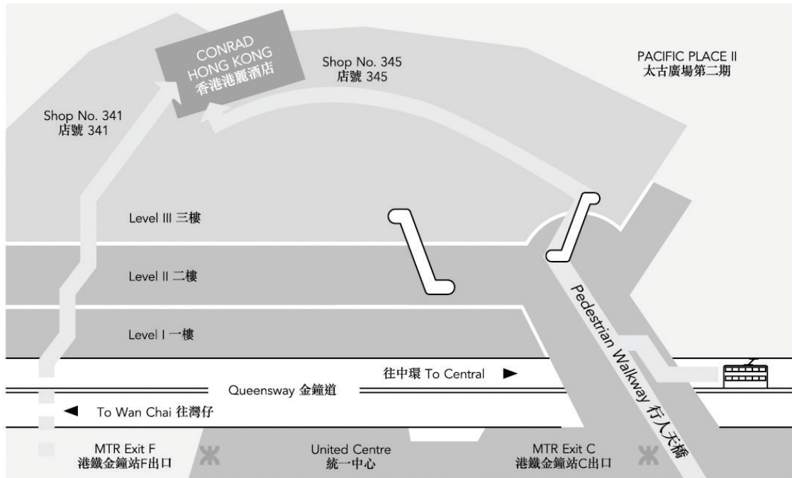
From MTR Admiralty Station to hotel 由金鐘港鐵站前往酒店