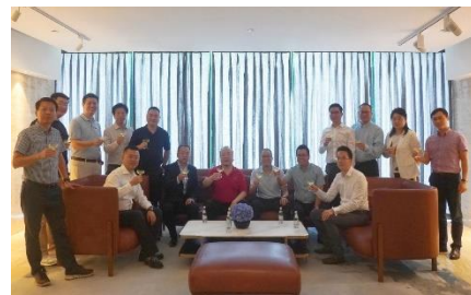
花样年与中国奥园签约 城市更新战略合作协议

(2020年8月4日—香港) 花样年控股集团有限公司(下称“花样年”或“集团”, 港交所股份代号: 1777) 公布2020年7月份销售业绩, 集团于7月实现房地产业务合同销售金额约48.03亿元, 同比增长30.9%; 相应已售建筑面积约为307,836平方米; 平均售价为每平方米约人民币15,602元。截至2020年7月31日7个月, 花样年累计完成合同销售金额223.09亿元, 同比上升32.5%; 相应已售建筑面积约为1,662,266平方米; 平均售价为每平方米约人民币13,421元。