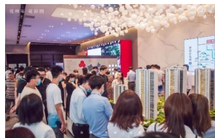
南京花好园项目开盘热销