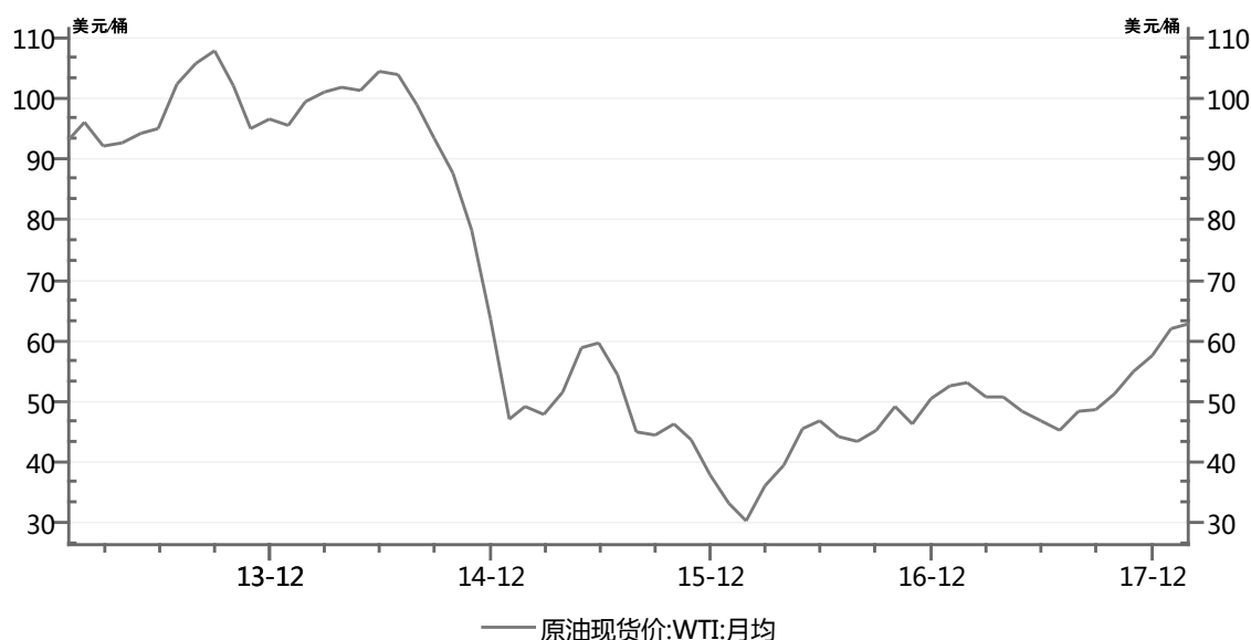
图1 2013年以来WTI国际原油现货价格变动情况 (单位: 美元/桶)

航油成本是航空公司的主要成本，近年来占航空公司运输服务业务成本的35%以上，航空燃油价格的波动直接影响航空运输服务业务成本的波动，进而影响航空运输企业经营稳定性。2014年以前，国际油价一直处于较高水平，但2014年下半年以来出现快速下跌。2014年，WTI原油现货价格从1月份的95.57美元/桶涨至6月份的105.40美元/桶，期间最高达到107.27美元/桶，而后受供需面利空等多重因素影响，WTI原油现货价格快速下跌至12月的53.77美元/桶，为2005年6月以来最低水平。2015年6月反弹至60美元/桶后再次下跌，2016年1月跌破30美元/桶。2016年5月再次反弹至45美元/桶。2017年上半年，原油价格总体有所下降，但随后原有价格快速拉升，截至2018年2月末，上涨至62.93美元/桶，较2017年月底最低价48.34美元/桶涨幅为14.59元/桶，从短期看，国际原油价格可能维持震荡的趋势，但未来价格变动仍然存在较大不确定性。