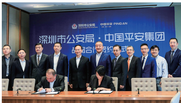
2018年4月27日，中国平安与深圳市公安局签署战略合作协议，携手“智慧新警务”建设。

2018年上半年，我们迈出了新十年稳健的第一步。面对复杂多变的内外部环境带来的诸多挑战，平安持续深化“金融+科技”、探索“金融+生态”，取得来之不易的成绩，位列《财富》世界500强第29位，首次跻身《福布斯》全球上市公司2000强第10位。